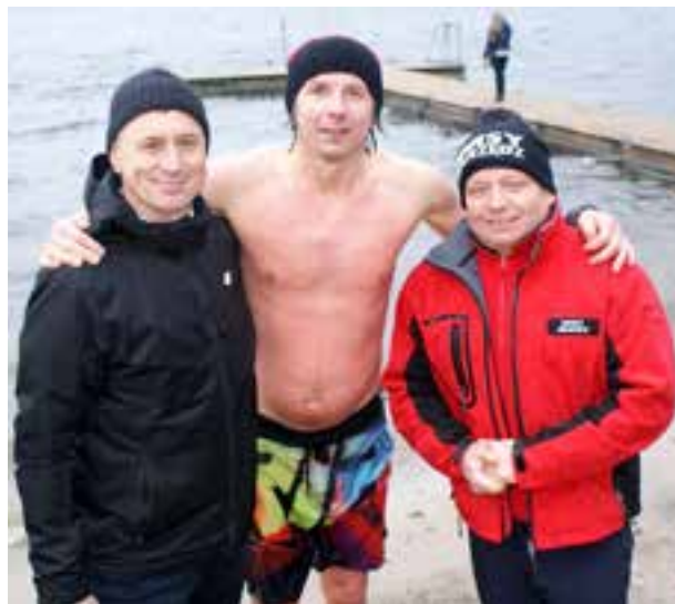
■ Fot. Piotr Nowak