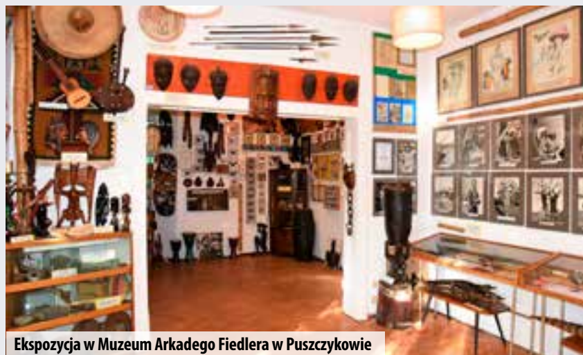
Ekspozycja w Muzeum Arkadego Fiedlera w Puszczykowie

Piotr Basiński Poznańska Lokalna Organizacja Turystyczna