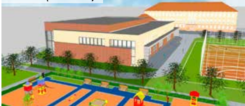
SP nr 2 w Swarzędzu – wizualizacja