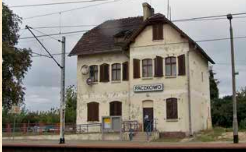
Budynek dworca kolejowego z lat osiemdziesiątych XIX wieku.