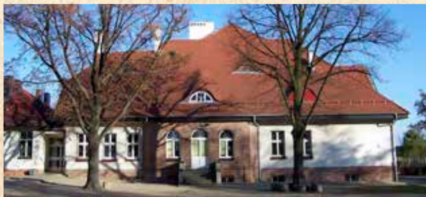
Dwór w Paczkowie z pocz. XX wieku.

... Wykaz sołtysów Paczkowa (niepełny) od 1990 r.: Piotr Kramkowski (1990 – 2010), Małgorzata Głabas-Gruszka (2010 -).