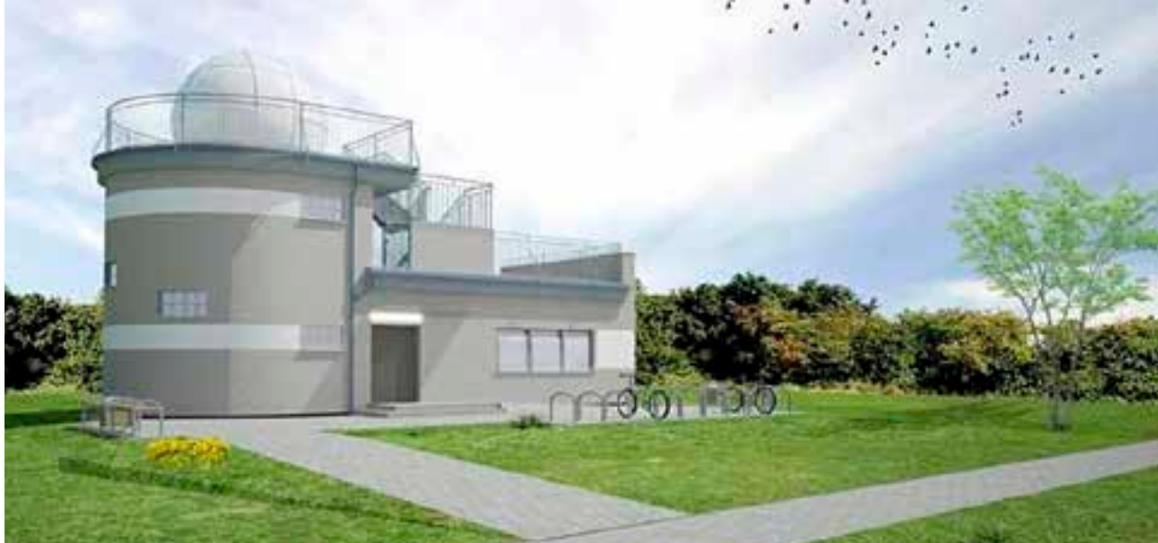
Wizualizacja obserwatorium astronomicznego, które ma powstać w ramach projektu Swarzędzkie Gwiazdne Wrota.