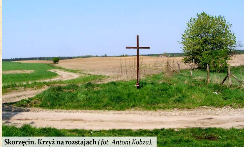
Skorzęcín. Krzyż na rozstajach.