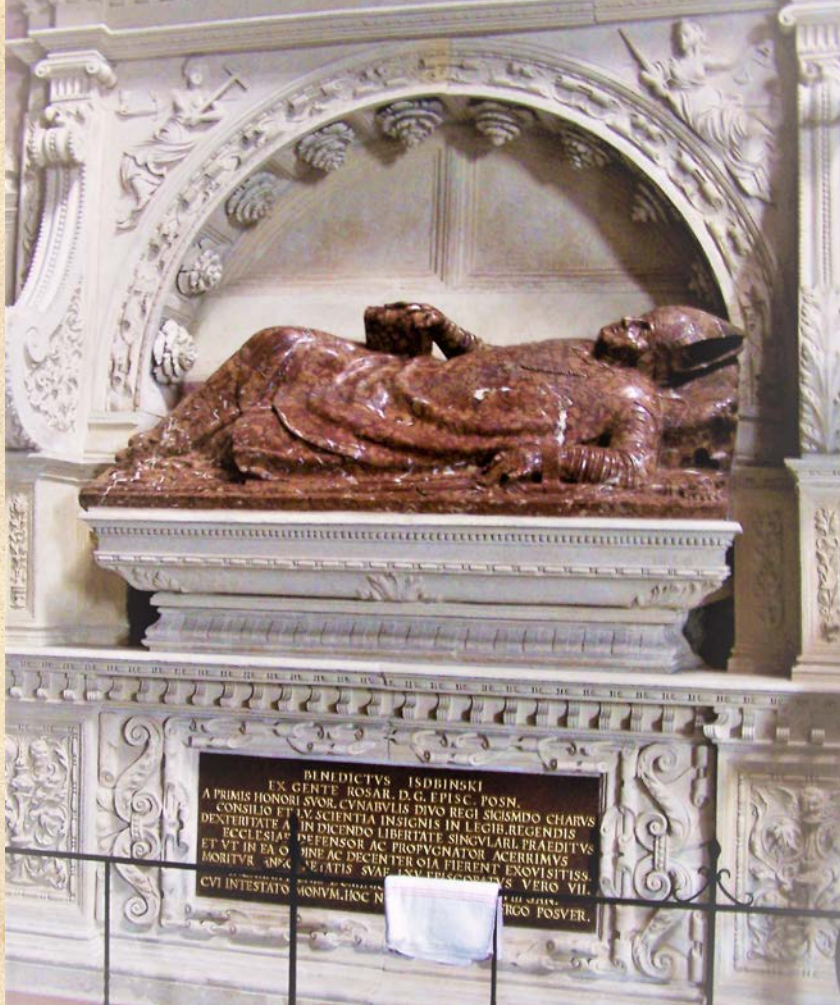
Grobowiec ks. bpa Benedykta Izd- bińskiego w katedrze poznańskiej, proboszcza parafii p.w. św. Marcina w Swarzędzu w l. 1516 – 1517 i w roku 1531.