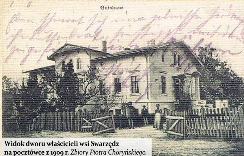
Widok dworu właścicieli wsi Swarzędz na pocztowce z 1909 r.

Kolejne miejscowości przedstawiane w naszym cyklu – oprócz opisanego już Mechowa w PzR nr 6(348) czerwiec 2018 r. oraz Katarzynek (PzR nr 2 (344) luty 2018) – to wsie, które zostały wchłonięte przez większych „sąsiadów”. Będą to więc dzieje Nowej Wsi, Nowego Dworu, Swarzędza Wsi i Święcinka.