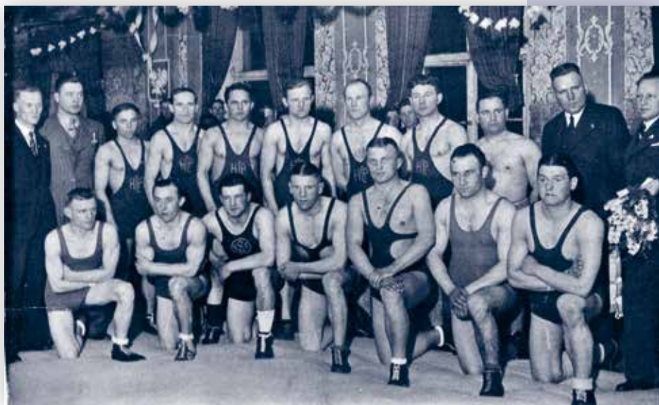
Zawodnicy SSS (Swarzędzkiego Stowarzyszenia Sportowego), 1937 r.