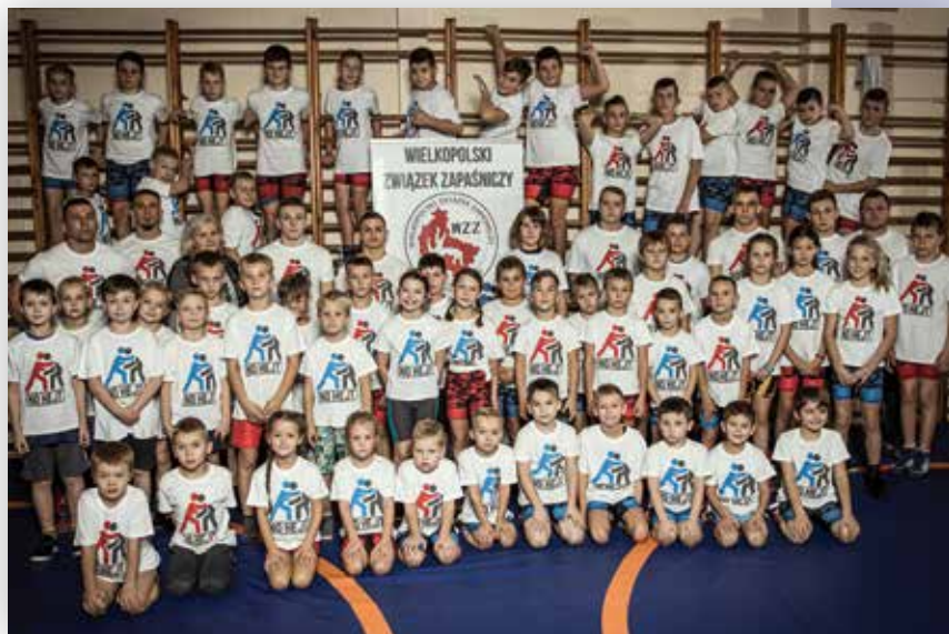
Zawodnicy Unii (2019 r.)